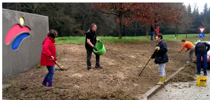
Mitglieder des Vereins bereiten den Boden vor.

Bei regnerischem Wetter bereiteten die Mitglieder des Vereins den Boden an der Info-Wand am Ortseingang Lohwald, für die Aussaat der Blumenmischungen, vor. Zuvor wurde die Grünfläche von den engagierten Gemeindearbeitern maschinell „gegrubbert“. Aufgerufen hat zu dieser Aktion der Bezirksverband der niederbayerischen Gartenbauvereine. Neben der kostenlosen Grundausstattung von Blumensamen für 30 m 2 Wiese, haben wir insgesamt Samen für